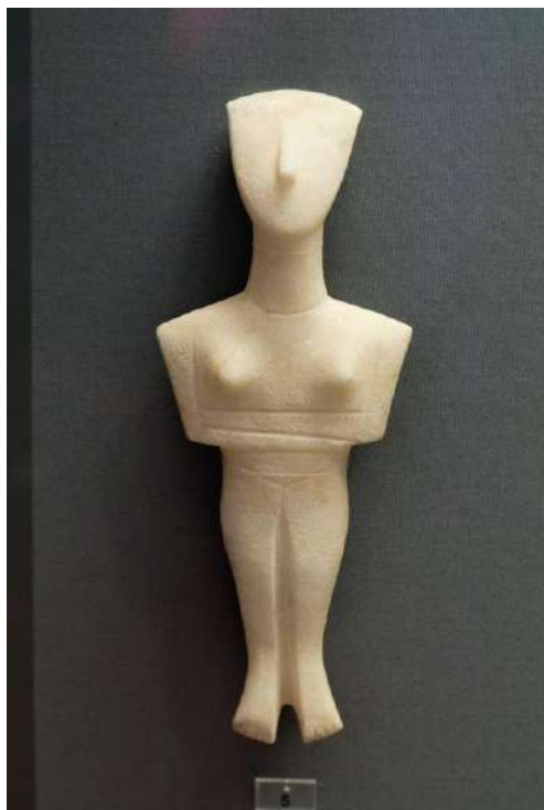
Figure cycladique féminine (Chalandriani, île de Syros) marbre, vers -2800/-2300

Après une introduction au contexte (culture, histoire et géographie), le cours d'histoire de l'art aborde en ce début de l'année 2020 les premières civilisations qui se développent à partir du 7 ième millénaire autour de la mer Egée. A l'articulation entre la Préhistoire et l'Histoire, entre -4000 et -2000, ces cultures pré-helléniques vont poser des jalons déterminants dans l'espace de la Méditerranée orientale.